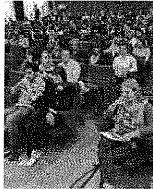
POLO ZANOTTO La festa di ieri

All'università di Verona le richieste di aprirsi a nuove culture e frequentare altri atenei per migliorare le lingue e accedere a stimolanti opportunità professionali non mancano. Lo scorso anno sono stati 308 gli studenti dell'ateneo scaligero che hanno scelto di studiare in un Paese dell'Unione europea. Per lo più Irlanda e Finlandia, in particolare le città di Berlino e Oulu. Ma sono tanti anche i giovani che tramite l'Erasmus arrivano a Verona per un'esperienza di scambio culturale che segni non solo il proprio percorso di studi ma anche quello di vita. Per quest'anno accademico è previsto infatti l'arrivo di oltre 280 studenti, ragazzi che vanno ad aggiungersi agli oltre 700 già frequentanti le facoltà veronesi in qualità di ospiti per studio. (j.c.)